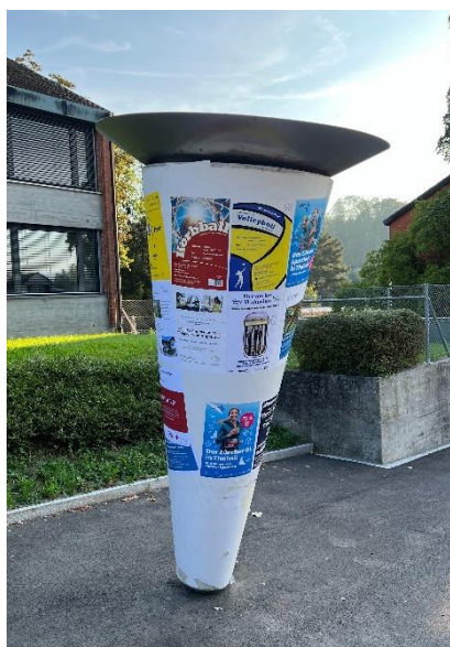
Beispiel Kulturnagel (vor dem Gemeindehaus)